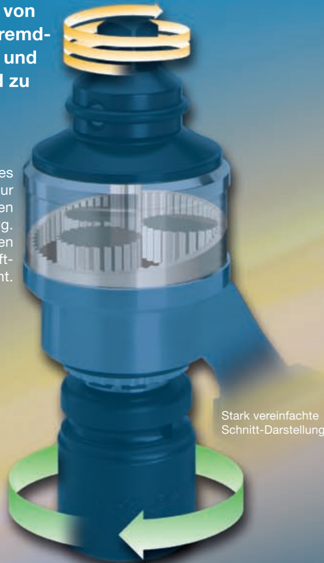
Stark vereinfachte Schnitt-Darstellung