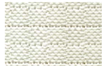
KlevoGlass 630-1 Karo