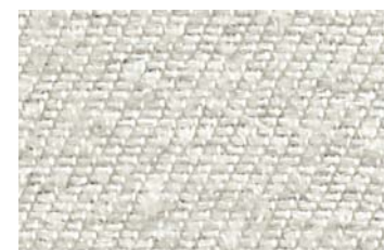
KlevoGlass Itex 400-1 K