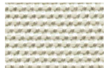
KlevoGlass Texo 2000-1 DG