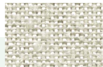
KlevoGlass Itex 450-1 L

Über unser komplettes Standardprogramm beraten wir Sie gerne. Vom Standard abweichende Konstruktionen fertigen wir auf Anfrage.