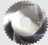
Sägeblatt mit zusätzlicher Bohrung