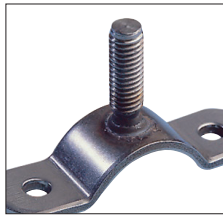
Anwendungsbeispiel Rohrleitungsbau Example of use Pipeline construction