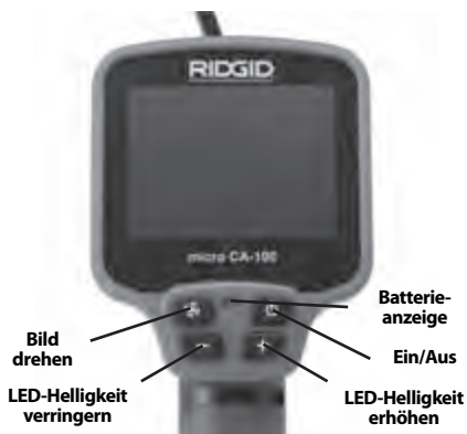
Abbildung 8 – Bedienelemente der Display-Einheit