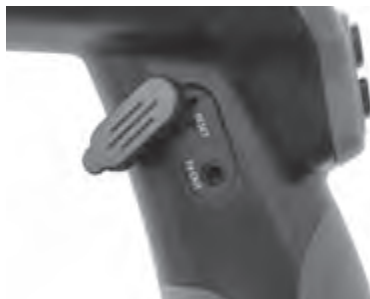
Abbildung 9 - TV-OUT-Buchse/Reset-Taste

Schließen Sie das andere Ende an die Videoeingangsbuchse am Fernsehgerät oder Monitor an. Eventuell müssen Fernsehgerät oder Monitor auf das richtige Signal eingestellt werden, um eine Betrachtung zu ermöglichen.