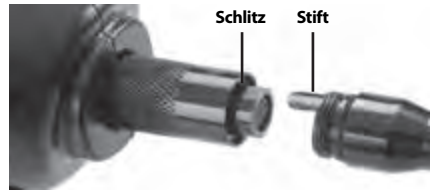
Abbildung 5 – Kabelanschlüsse

Für den Betrieb der micro CA-100 Inspektionskamera muss das Kabel des Kamerakopfs an die Display-Einheit angeschlossen werden. Für den Anschluss des Kabels an die Display-Einheit müssen Stift und Schlitz ( Abbildung 5 ) richtig zueinander ausgerichtet sein. Dann den Rändelknopf handfest anziehen, damit der Anschluss fest sitzt.