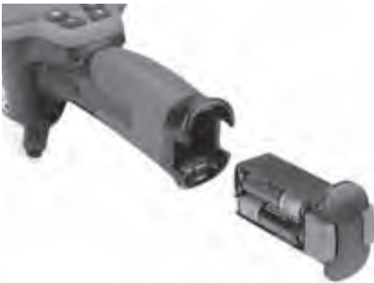
Abbildung 4 – Batteriefach