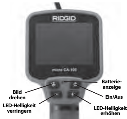
Abbildung 2 - Bedienelemente der Display-Einheit