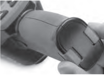
Abbildung 3 – Batterieabdeckung