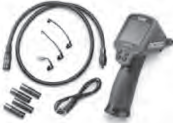
Abbildung 1 - micro CA-100