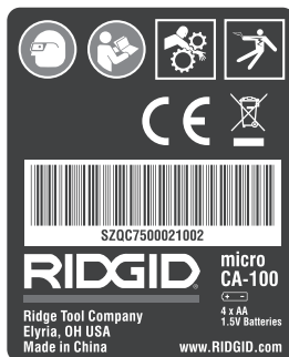
Abbildung 7 – Warnschild