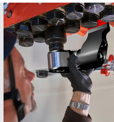
alkitronic® AT Einsatz in einer Windkraftanlage