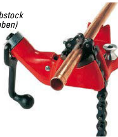
Kettenrohrschraubstock (Spannschraube oben)