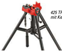
425 TRISTAND mit Kettenschraubstock