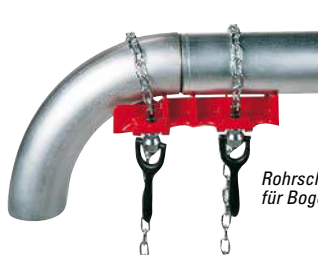
Rohrschweißschraubstock für Bogen