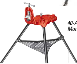
40-A TRISTAND mit Montageschraubstock