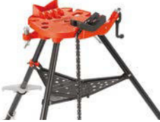
460-12 TRISTAND mit Kettenschraubstock