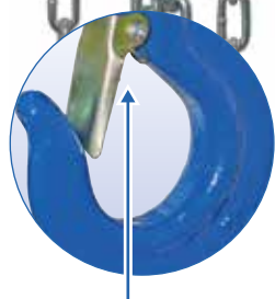
Geschmiedeter Sicherheitshaken mit passgenauer Hakensicherung