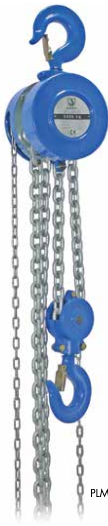
PLM-II 5 t