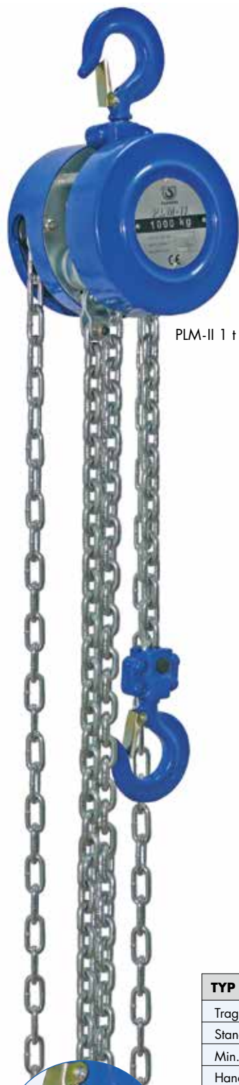
PLM-II 1 t