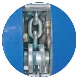
Komplett verzinktes Innengehäuse