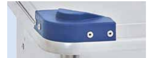
Robuste, witterungsbeständige Stapelecken aus Kunststoff