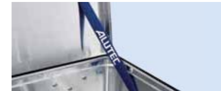
Stabiler, weit öffnender Klappdeckel mit zwei Fangbändern zur Entlastung der Scharniere