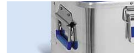
Ergonomische, selbsteinklappende Sicherheitstragegriffe mit hoch belastbarer, rutschfester Kunststoffummantelung