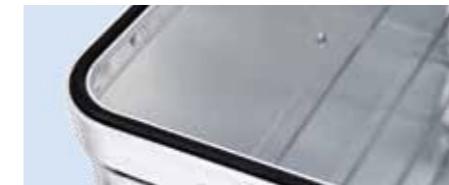
Staub- und spritzwassergeschützt durch auswechselbare, langlebige Gummidichtung im Rahmenprofil