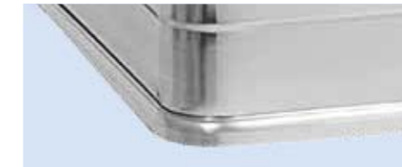
Versteifung durch Aluminiumprofile an Behälter und Deckel