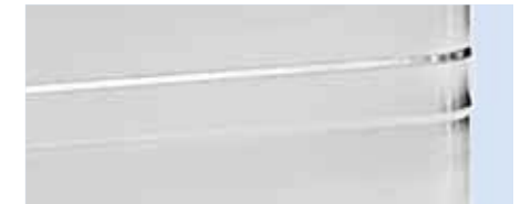
Stoßsicher und formbeständig durch geprägte, umlaufende Verstärkungssicken