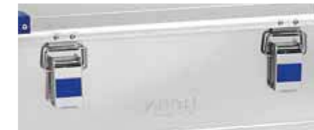
Robuste, sicher schließende Hebelspannverschlüsse mit Bohrung für Plomben oder Vorhängeschlösser. Zur Montage von Zylinderschlössern (Zubehör) vorbereitet