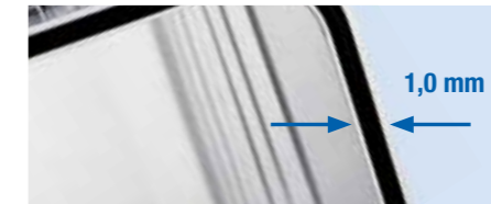
Extra stabil, korrosions-, witterungs- und temperaturbeständig aus 1,0 mm starkem, hochwertigem Aluminium

Durch unsere Eigenfertigung auf modernsten aluminiumblechverarbeitenden Spezialanlagen mit laufender Chargenkontrolle sind ALUTEC MÜNCHEN-Aluminiumboxen Präzisionsbehälter mit langer Lebensdauer – Made in Europe.